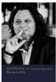
DEUR MURRAY LA VITA TAFELBERG R165