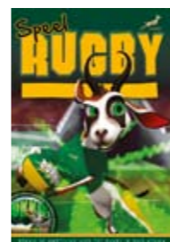
DEUR ANDY COLQUHOUN PEARSON R119,95