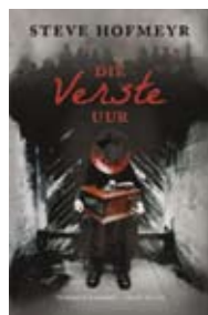
DEUR STEVE HOFMEYR ZEBRA PRESS R150