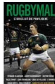
SAAMGESTEL DEUR JACO KIRSTEN TAFELBERG, R160